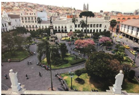
首都キト市中心部