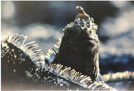
海イグアナの親子

港区立『神明いきいきプラザ』にて、 動植物をはじめ、文化や伝統など多様性を誇るエクアドルを 写真パネルでご紹介します。